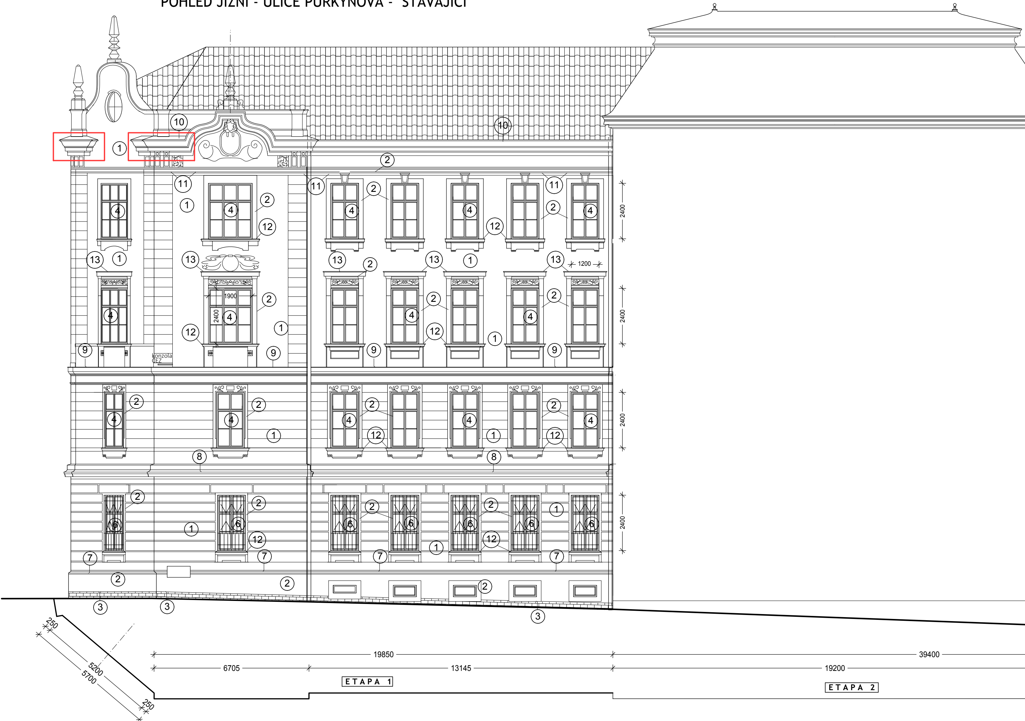
POHLED JIŽNÍ - ULICE PURKYŇOVA - STÁVAJÍCÍ